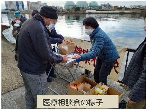
医療相談会の様子

また、東京都からの依頼により、年末年始に居所を失った方が一時利用できる宿泊先として、ふるさと2丁目ハウスの6室を確保。相談窓口である「東京チャレンジネット」を通じて、4名の方が年明け5日の早