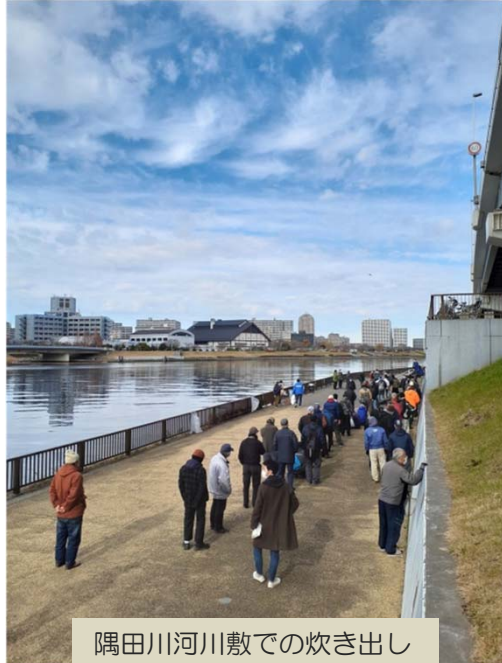
隅田川河川敷での炊き出し

ホームレス支援の施策や諸々の福祉制度の活用が進んだこともあり、炊き出しに並ぶ方の数は年々減少する方向にありましたが、今回は極端に数が少なく（下記、実績を参照）、初日は調理したカレーを寸胴一つ分廃棄する事態になりました。必要な方に食事が行き届かないことは避けたい一方で、フードロスを防ぐ観点もまた重要であり、翌日からは食数を調整したり、炊き出しに来ない方に届けたりと工夫を行いました。炊き出しの現場ではタッパーを持参し、知人のために持ち帰りをする人なども多く見られ、必要な方にどのようにアクセスするかが今後の課題となりそうです。