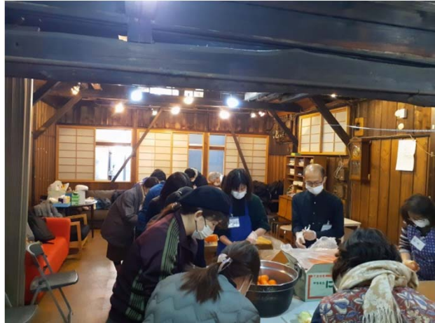
↑ 三富製作所での調理は今回が最後となりました

朝まで利用されました。内、2名の方は、ふるさとの会の施設への入居を希望し、継続的な関わりとなりました。形は違えど年末年始に支援を要する方にむけて、活動を続けてまいります。