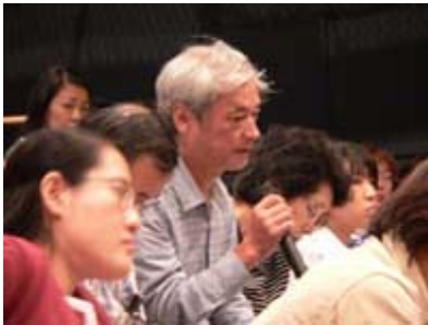
会場からもたくさんの質疑が寄せられました