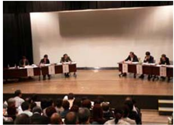
行政、医療機関、NPOなど業態、業種を超えた連携が火急の課題であることが確認されました