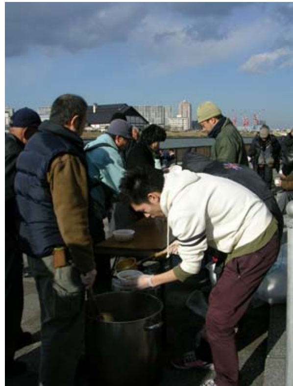
寒い中一杯の温かい食物が心まで暖めてくれるよう

発行元：特定非営利活動法人 自立支援センターふるさとの会 〒111-0031 東京都台東区千束4-39-6 TEL: 03-3876-8150 FAX: 03-3876-7950 hurusato@d5.dion.ne.jp HP : http://www.d5.dion.ne.jp/~hurusato/