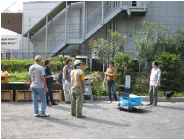
エイドステーション設営開始