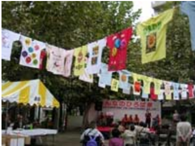
台東区内の様々な団体が一堂に