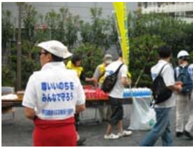
飲料提供は大事な役目です