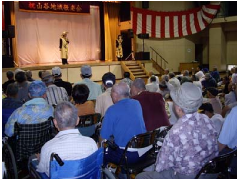
オヨネーズの軽妙なトークに観衆も徐々にステージに注目