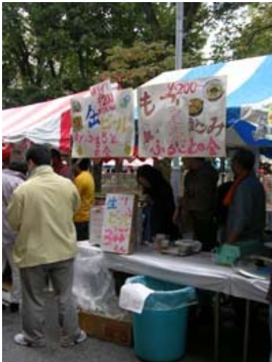
名物ふるさとの会煮込みはいつも大人気