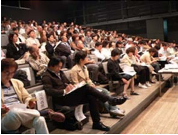
今年も200名を超える方々が参加。関心の高さがうかがえました