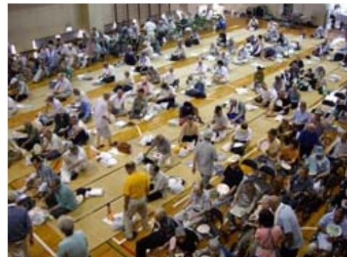
椅子席、敷席次々に会場は埋まっていきます