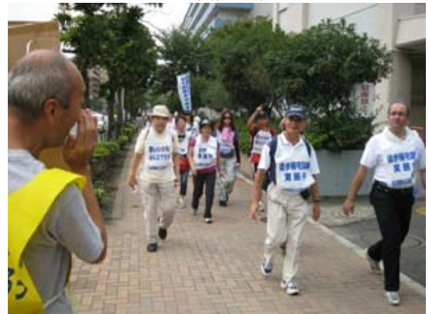
徒歩帰宅訓練参加者に声をかけて励まし情報提供訓練を行う