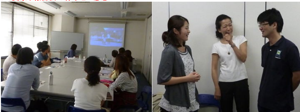
左)映像を観ているところ 右)談笑しているところ